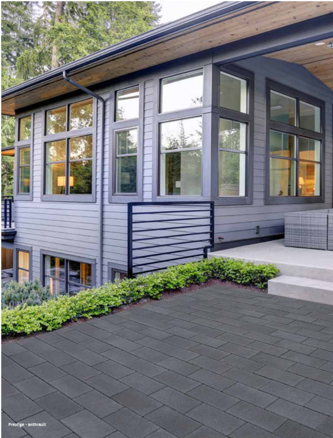
Prestige - anthrazit