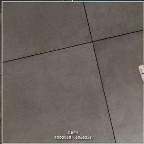
GREY 4000058 - 60x60x2