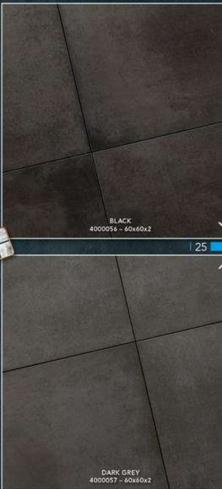
BLACK 4000056 - 60x60x2