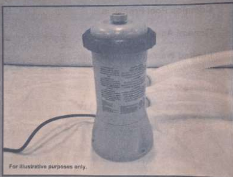
For illustrative purposes only.

Don't forget to try these other fine Intex products: pools, pool accessories, inflatable pools and in-home toys, airbeds and boats available at fine retailers or visit our website.