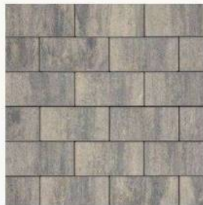
CATANA GRAU-ANTHRAZIT NUANCIERT