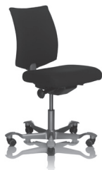
HÅG H05 5200 standardmäßig mit Armlehnen