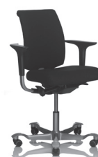
HÅG H05 5300