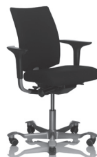
HÅG H05 5400