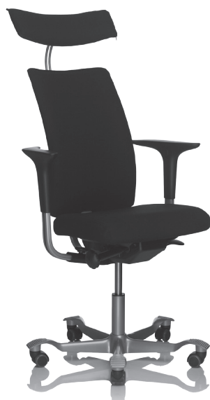
HÅG H05 5600 optional mit Kopfstütze