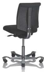
HÅG H05 5100 standardmäßig mit Armlehnen