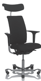
HÅG H05 5500 optional mit Kopfstütze